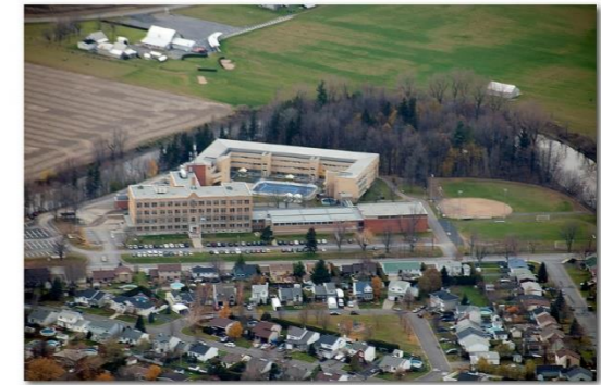
Jean-Pierre Dorin 2011

http://letremplin.csp.qc.ca/files/2019/12/2018-2022_Projet-%C3%A9ductif.pdf